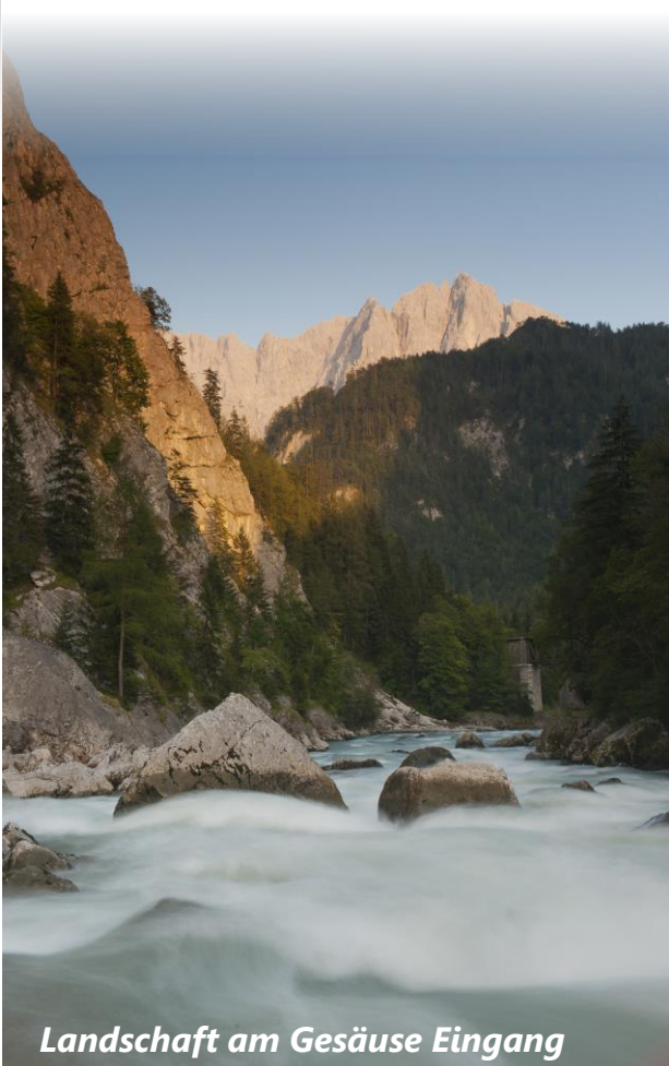
Landschaft am Gesäuse Eingang

Die Enns bildet ein Biotop für Pflanzen und Tiere, die in stärker regulierten Flüssen nicht mehr überleben können. Flaggsschiffart ist der Flussuferläufer , im Gesäuse findet sich das größte Brutvorkommen in der Steiermark.