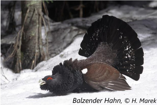
Balzender Hahn

In der Steiermark ist die Art ein regional vorkommender Jahresvogel. Die Bestände im Norden der Steiermark werden als zufriedenstellend eingeschätzt. Die Zahl der Individuen nimmt allerdings jährlich ab.